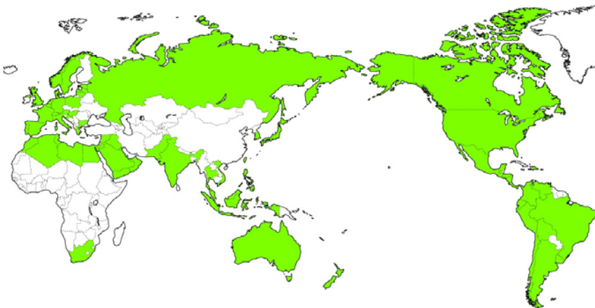
※ 着色部分が展開地域（2011年6月現在）

日本、アルジェリア、アンドラ、アルゼンチン、アルバ、オーストリア、バハマ、バーレーン、ベルギー、ボリビア、ブラジル、ブルガリア、カナダ、チリ、コロンビア、コスタリカ、クロアチア、デンマーク、ドミニカ共和国、エクアドル、エジプト、エルサルバドル、エストニア、フランス、ドイツ、ギリシア、グアテマラ、ホンジュラス、香港、ハンガリー、インド、インドネシア、イラク、イスラエル、イタリア、ヨルダン、クウェート、韓国、ラトビア、リビア、リトアニア、ルクセンブルク、マレーシア、メキシコ、モロッコ、オランダ、ニュージーランド、ニカラグア、ノルウェー、オマーン、パキスタン、パナマ、ペルー、フィリピン、ポーランド、ポルトガル、カタール、ロシア連邦、シンガポール、サンマリノ、サウジアラビア、南アフリカ、スペイン、スウェーデン、スイス、シリア、台湾、タイ、チュニジア、アラブ首長国連邦、英国、米国、ウルグアイ、ベネズエラ、ベトナム、イエメン など