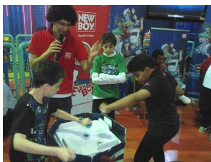
店頭大会で真剣に対戦する子どもたち（サウジアラビア）