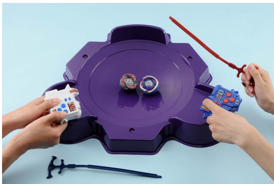
スーパーコントロールベイブレード 使用イメージ （左：エルドラゴデストロイ・右：ビックバンペガシス /各3,885円） （スーパーコントロールベイブレード専用 スタジアム /2,100円）