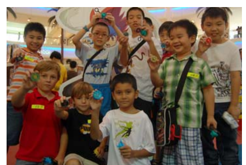
自分の「ベイブレード」を持ち大会に参加する子どもたち（マレーシア）