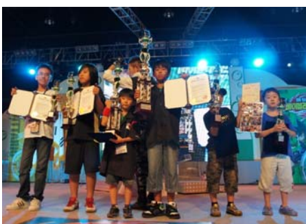
2010年8月開催「アジアチャンピオンシップ」表彰式（韓国）